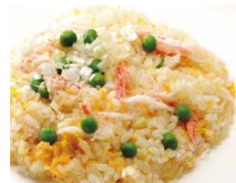
かに肉チャーハン