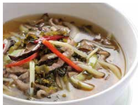
細切り豚肉と高菜つゆそば