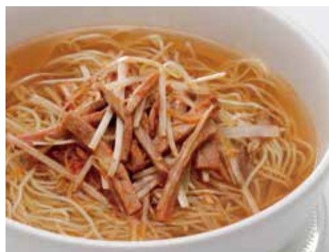
葱とチャーシューつゆそば